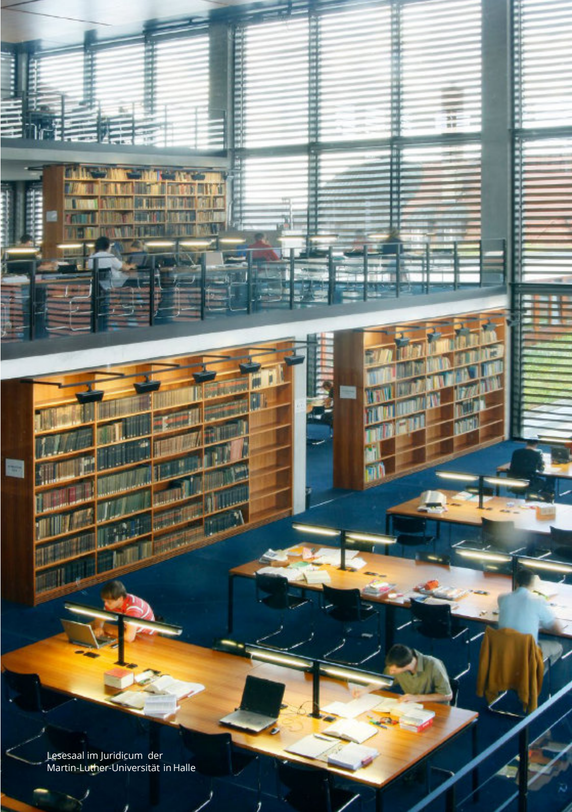
Lesesaal im Juridicum der Martin-Luther-Universität in Halle