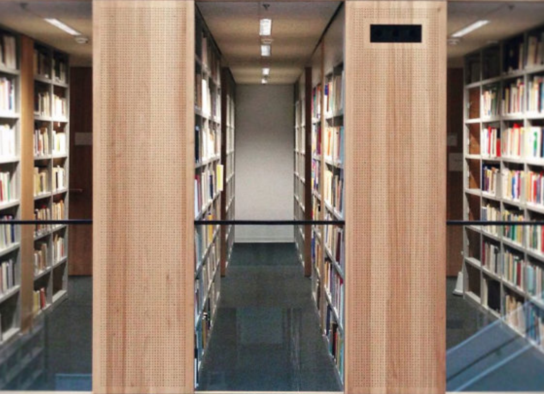
Zweigbibliothek der Martin-Luther-Universität am Steintor-Campus in Halle