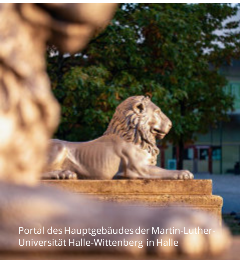
Portal des Hauptgebäudes der Martin-Luther-Universität Halle-Wittenberg in Halle

Auf master-halle.de finden Sie ein Self-Assessment das Ihnen dabei hilft, herauszufinden, ob unsere Weiterbildungsangebote zu Ihren Interessen passen. Darüber hinaus können Sie die Buchung einzelner Module auch direkt über die Website anfragen.